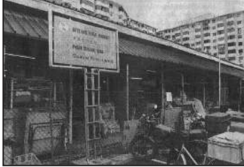
Gambar Geylang sebelum peningkatkan

“Geylang si paku Geylang Geylang si rama-rama Pulang marilah pulang Marilah pulang bersama-sama”