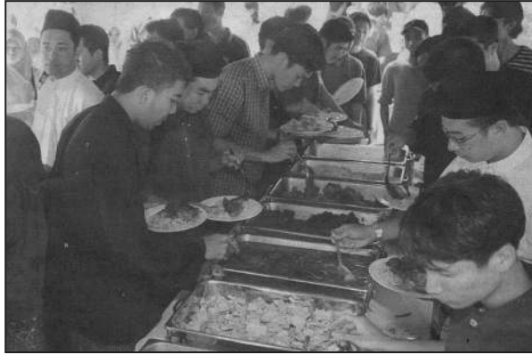
Suasana Rumah Terbuka semasa sambutan Hari Raya

Ramai orang mungkin berpendapat bahawa sambutan Deepavali, Hari Raya Aidilfitri, Hari Krismas dan Tahun Baharu Cina ialah sambutan yang berlainan dan jauh berbeza-beza. Memanglah, sekiranya kita semata-mata melihatnya dari sudut latar belakang dan tradisi sejarah serta asal usulnya, maka kita akan melihat pelbagai perbezaan. Namun, sekiranya kita melihatnya dari sudut perkembangan tradisi dan kebudayaan bangsa di Tenggara Asia, banyaklah persamaan yang dapat diperhatikan. Sebagai contoh, teman anda daripada keturunan Cina semakin kerap menghidang sate, salah satu makanan Melayu, apabila menjamu selera pada Tahun Baharu Cina. Sementara, pada Hari Raya Aidilfitri pula, orang Melayu juga kerap menghidangkan muruku, makanan ringan kaum India.