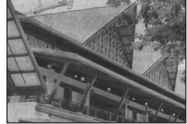
Gambar Geylang selepas peningkatkan

“Geylang si paku Geylang Geylang si rama-rama Pulang marilah pulang Marilah pulang bersama-sama”